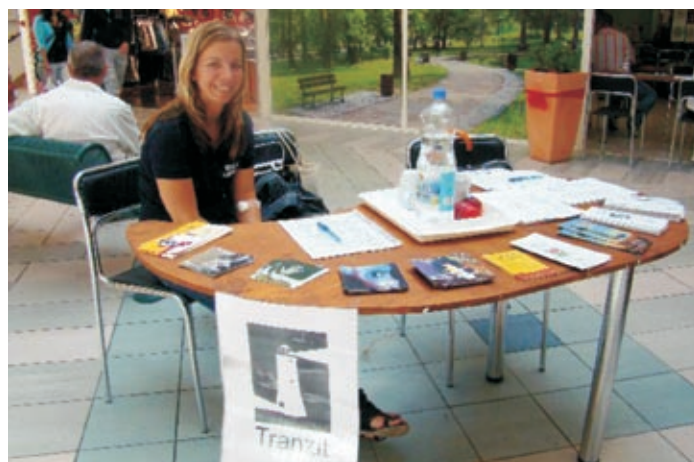
Drogprevenció, a Tranzit önkénte