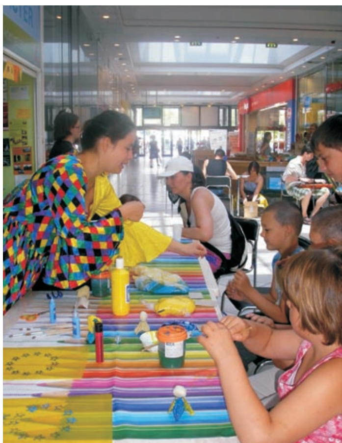
Önkéntes nap a Civil Piactéren