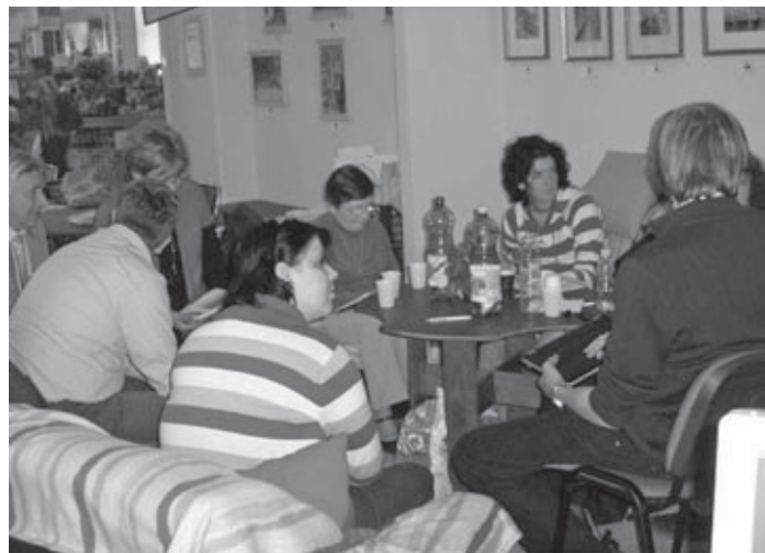
Önkéntes workshop a Civil Piac téren

Civil Szervezetek Regionális Szövetsége Fejér Megyei Önkéntes Centrum Székesfehérvár