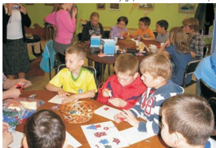
Martonvásári önkéntesek kézműves-napja a Civil Piactéren