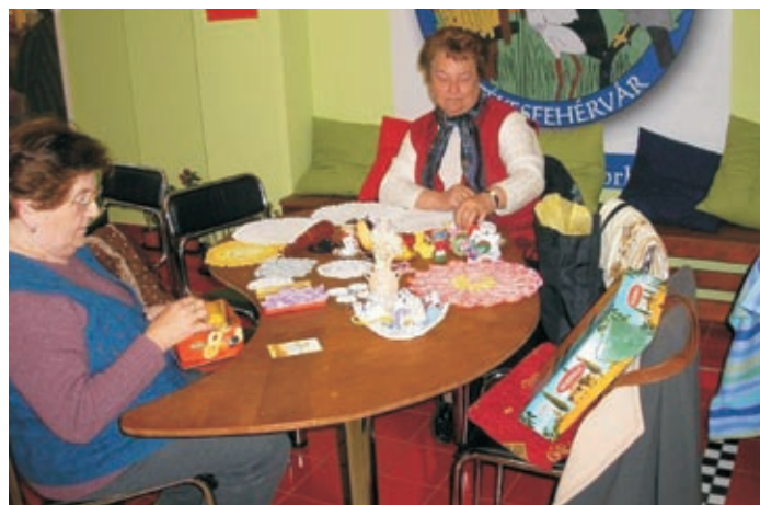
Nyugdíjas önkéntesek a kézműves napon