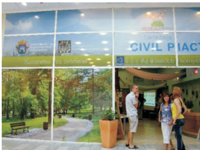
Az önkéntesekkel működtetett Civil Piactér bejárata