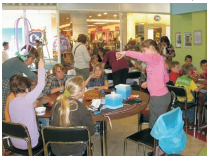
Martonvásári önkéntesek kézműves-napja a Civil Piactéren