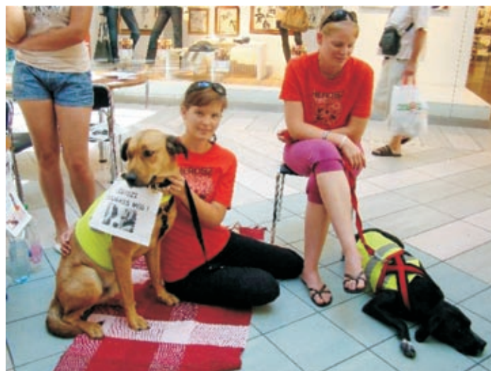
Herosz – önkéntesek a hontalan állatok világnapján